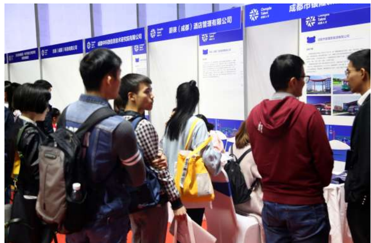
新区招聘单位吸引着青年学子