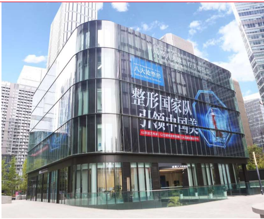
成都八大处医疗美容医院

据天投金控公司相关负责人介绍,这一项目是公司布局大健康产业链的第一步,合作主要以股权投资为主,未来天投金控公司将整合金融链、产业链、创新链等资源打造天府新区大健康产业。“我们有严格的投资标准,只有社会效益与经济效益并重的项目,才会被纳入考核范围。”天投金控公司的相关负责人透露,目前,公司正在跟省市及国家级的医院、健康产业机构对接,探讨将各类优质医疗资源引入新区。